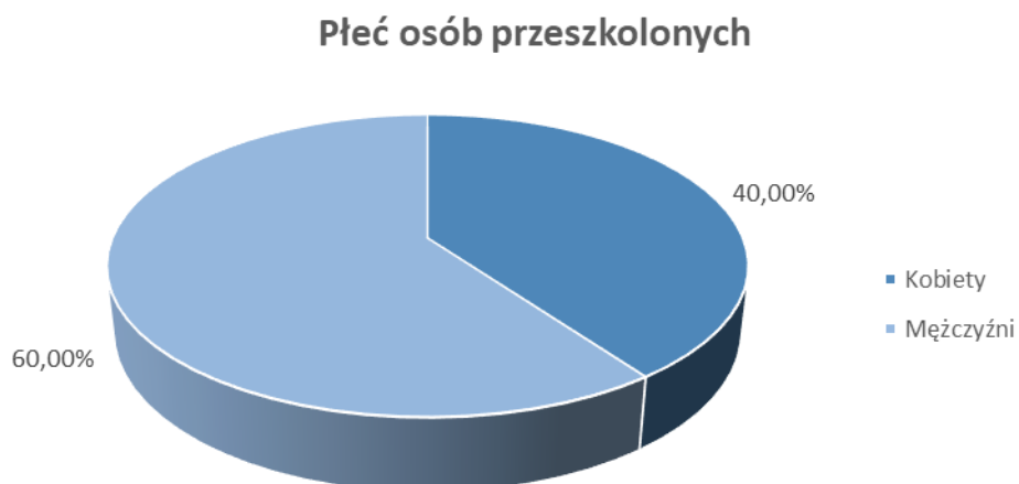
Wykres 1. Udział % osób przeszkolonych - rozróżnienie ze względu na płeć

Spośród wszystkich osób przeszkolonych 60% stanowili mężczyźni.